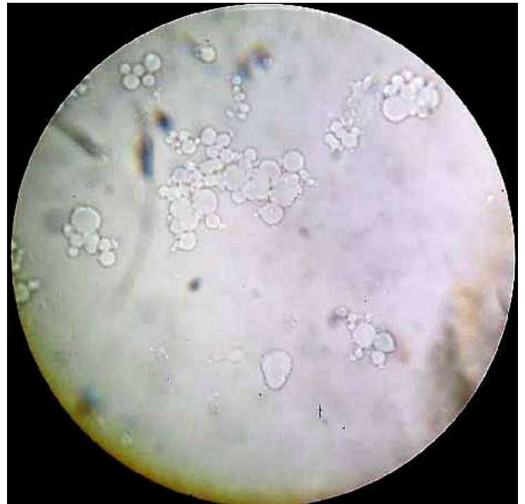
Coacervats en microscopie optique (x 600)